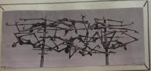
A view of the Imperial Army structure by Yugoslav engineer Gid Dander, 1948. Dander spent time in a Soviet labor camp during the war and later fought with the Yugoslav partisans. Other research by Dander may be seen at the Manhattan Project and at Soboritz.