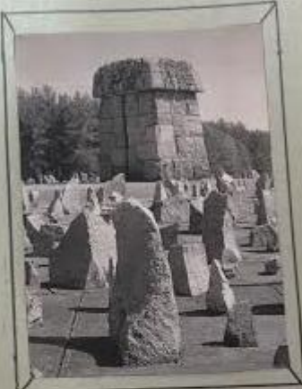
Treblinka Jewish monument 1966 view.