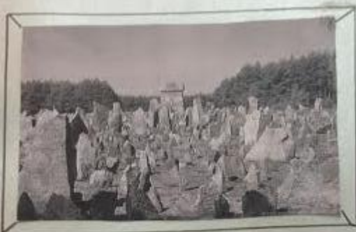
Yerushala, built at 11000 years, representing the last Jewish temple in Jerusalem.