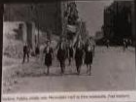
Preživjeli holokausta u Beogradu, 1945. godine.

U siječnju 2000. je usvojen akt o danu sjećanja na žrtve holokausta. Dan sjećanja na žrtve holokausta je jedan od najvažnijih dokumenata u području međunarodnog prava. Dan sjećanja na žrtve holokausta je jedan od najvažnijih dokumenata u području međunarodnog prava.